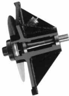
Poikkeuksellisen vahva laakerointi